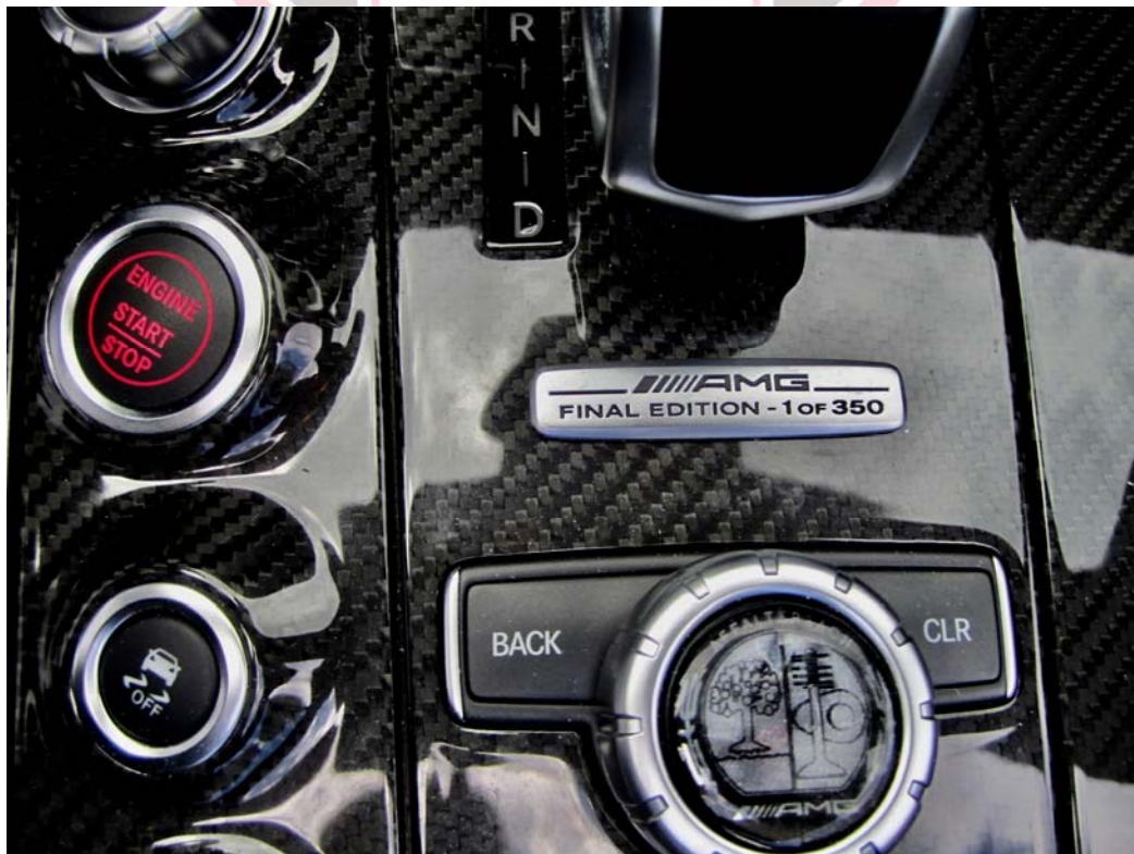
Plakette „1 of 350“ auf Mittelkonsole