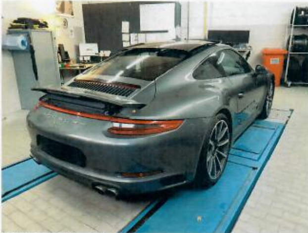
Abbildung 3: Schräg hinten