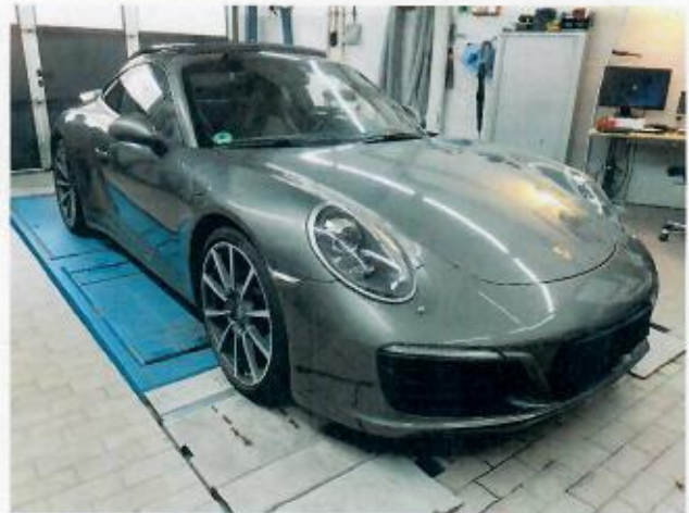
Abbildung 2: Schräg vorne