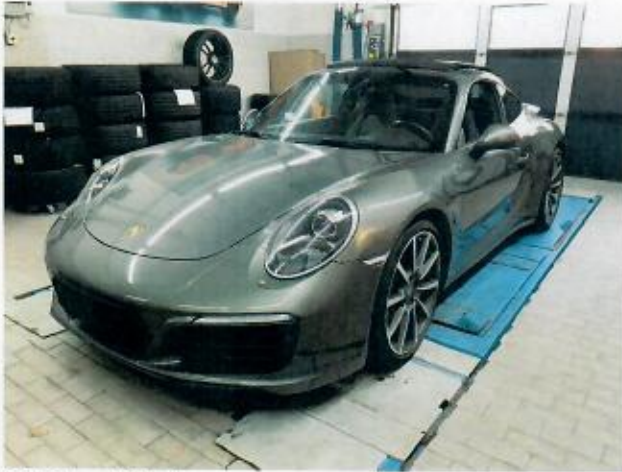
Abbildung 1: Schräg vorne