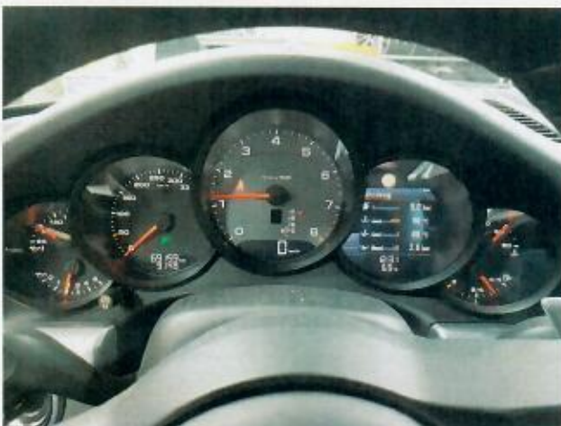
Abbildung 5: Innenraum