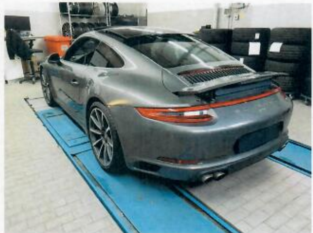
Abbildung 4: Schräg hinten