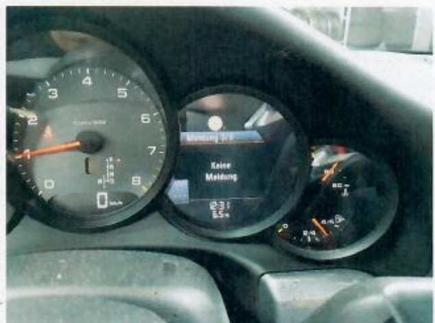
Abbildung 6: Innenraum